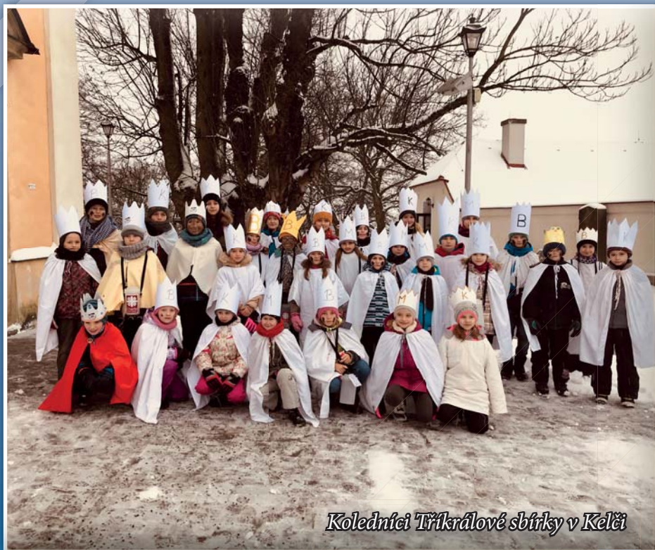
Koledníci Tříkrálové sbírky v Kelči