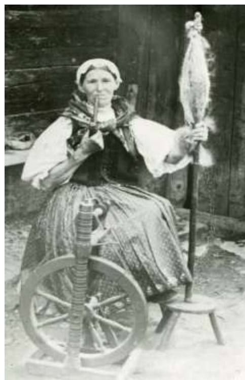
Kouřící žena. Nový Hrozenkov r. 1895.

K oblibě kouření dýmek je nutno podotknout, že nebylo výhradně mužskou záležitostí. Už první zpráva o kouření tabáku vůbec, a to poznámka v deníku Kryštofa Kolumba hovoří o domorodcích - mužích i ženách - s čímsi podobnému opálenému dřevu v rukách. Také v horských oblastech Valašska, zejména v okolí Vsetína, Rožnova a Valašských Klobouk nebývaly ženy s fajfkou v ústech výjimkou. Týkalo se to však jen provdaných žen, svobodná děvčata si zakouřila jen tajně, protože „ kúřit' bylo na slobodnú cérku haňba a nebylo to súcí. “