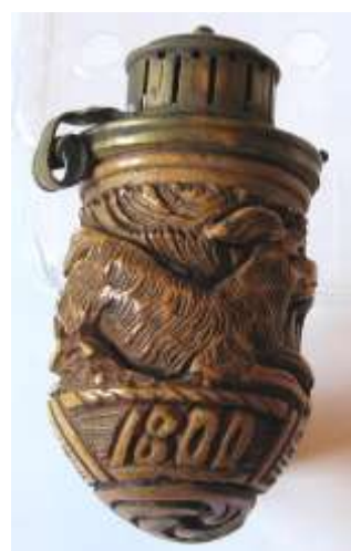
Hlavička dýmky pěnovky z r. 1800. Ze sbírek valašskomeziříčského muzea

K dýmčím, které se u nás sice příliš nevyráběly, ale kvůli kvalitě kouření, již poskytují, jsou dodnes velmi populární, náleží dýmky z mořské pěny – zvané pěnovky či meršánky . Ty se zhotovují ze vzácného bílého nerostu – sepiolitu, který se těží v Turecku a Africe a fajfky se z něj vyrábí od roku 1723. Zvláštností tohoto minerálu je schopnost zbarvovat se kouřením do zlatohněda a tvárnost, jež umožňuje jemné řezby.