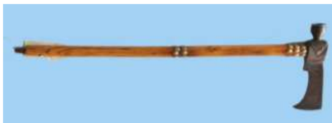
Indiánská dýmka - tomahavk

Požitek z kouření tabáku za pomoci dýmek si vychutnávali už téměř před 3000 let američtí Indiáni. Kouření bylo pro ně zpočátku náboženským obřadem vyhrazeným pouze kněžím, neboť tabáku byla prisuzována léčivá moc a spojení s bohy. Teprve postupem doby se kouření stávalo každodenní součástí života Indiánů. V Severní Americe byly v té době velmi rozšířené dýmky kamenné či hliněné, v Americe Jižní to pak byly dýmky z různých druhů tropických dřevin. Z předkolumbovské Ameriky jsou známy i dýmky