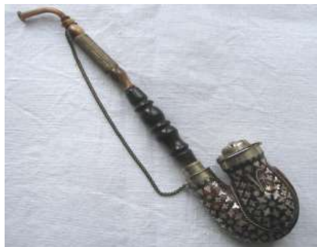
Dýmka „valaška“ vybíjená perletí a drátkem. Vyrobená asi ve Velké Lhotě kolem r. 1860. Ze sbírek vsetínského muzea