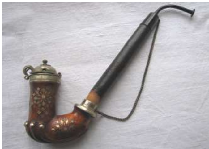
Dýmka „valaška“ vybíjená perletí. Vyrobená v Malé Bystřici kolem r. 1900. Ze sbírek vsetínského muzea

V našem regionu dosáhlo největšího rozmachu dýmkařství v městečku ležícím na pomezí Valašska a Hané – v Kelči . Kromě profesionálních dýmkařů kelečských se ale výrobci dýmek nacházeli i v dalších vesnicích Valašska. Nebylo jich však mnoho. Často to bývali samouci nevyučení v oboru, kteří si výrobou dýmek pouze přivydělávali. Tito fajkáři nejvíce prosluli zhotovováním dýmek vykládaných perletí, někdy i mosaznými a železnými drátky, zvaných podle oblasti výroby fajky valašky .