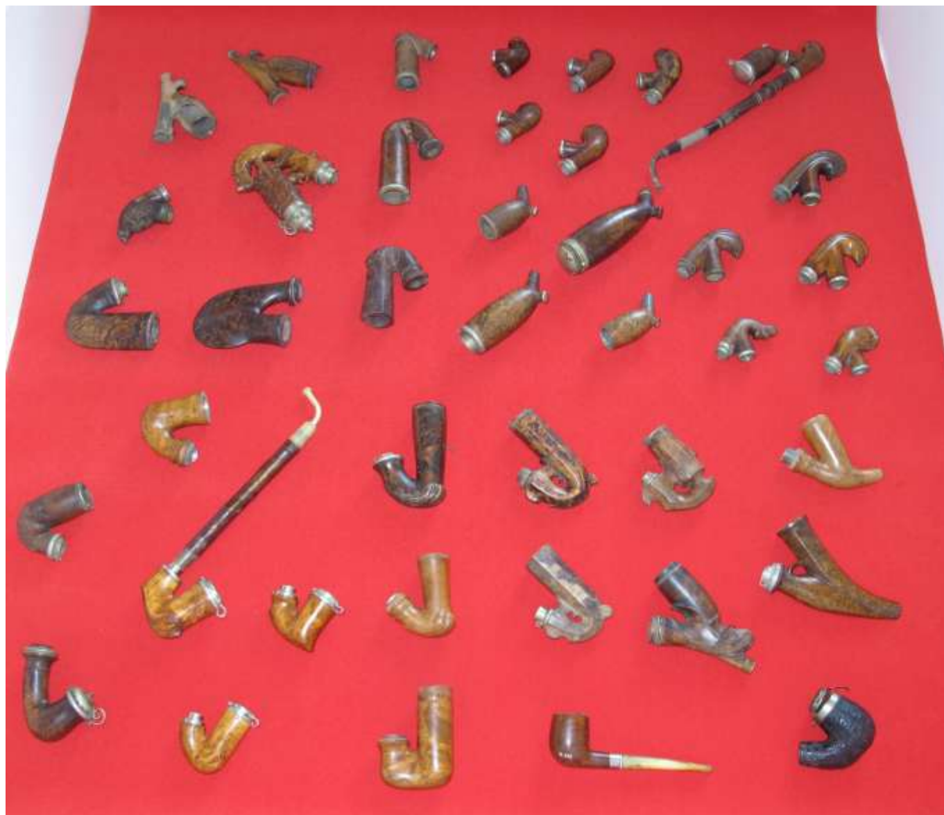
Kelečské dýmky v expozici Po stopách kelečského dýmkařství

Vydalo Muzeum regionu Valašsko, p. o. za financování Města Kelč v roce 2012 jako doprovodnou publikaci k expozici Po stopách kelečského dýmkařství .