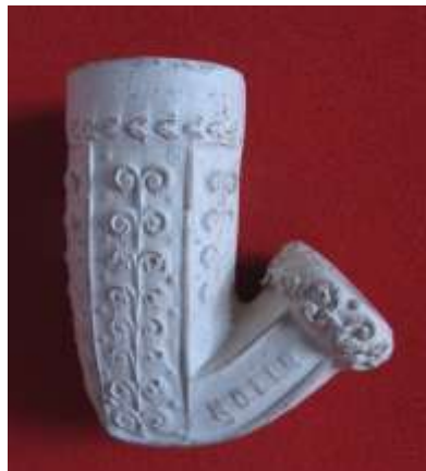
Hlavička dýmky „gypsovky“ zvané „vídeňská kavárenská“. Ze sbírek vsetínského muzea

Jako první výrobci dýmek u nás jsou uváděni habáni (náboženská sekta novokřtěnců), což byli velmi zruční řemeslníci, zejména keramici. Ti v 17. století zhotovovali mimo jiné také keramické dýmky s bílou glazurou a jednoduchou malbou. Výroba hliněných dýmek doznala v našich