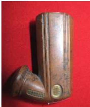
Hlavička dýmky „štiavničky“ firmy Zachar. Ze sbírek vsetínského muzea

zemích velkého rozšíření hlavně v 18. a 19. století. Na Slovensku se zhotovovaly dýmky z barevné hlíny, nazývané podle centra výroby v Banské Štiavnici – „štiavničky“, jež si svou popularitu získaly po celé Evropě i v USA. V Čechách byla největším výrobcem hliněnek z bílé hlíny tzv. „gypsovek“ dílna v Kolíně.