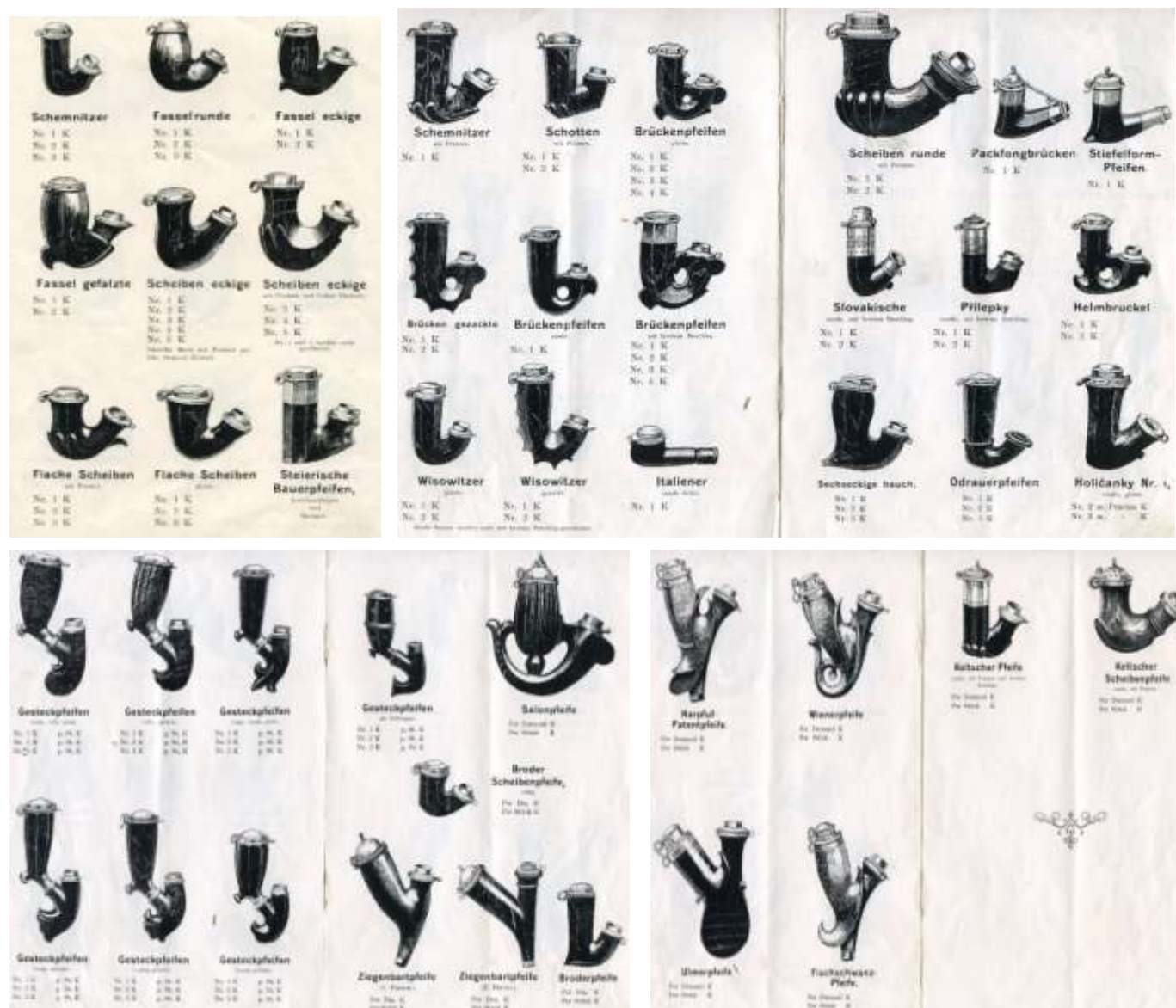
Kelečské dýmky z ceníku firmy J. Pajdla, Kelč, výroba a obchod ve velkém všemi druhy dřevěných dýmek

1895 v Kelči zřízena pokračovací škola, bylo na ní zapsáno 15 dýmkařských učňů. Slibný rozvoj dýmkařství pokračoval jen s mírnými výpadky na konci 19. století nerušeně až do 1. světové války. Ještě před jejím vypuknutím bylo ve městě 12 samostatných mistrů, z nichž 2 větší podnikatelé zaměstnávali až 50 rodin.